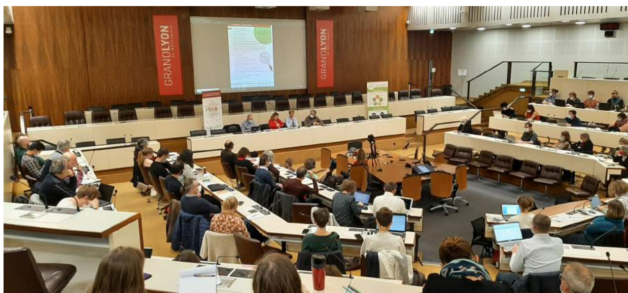
Figure 1: 6èmes Rencontres Collectivités – Monnaies Locales par le mouvement SOL et le réseau RTES en novembre 2021

Le rapport d'activité 2021 souhaite montrer l'impact du Cairn sur l'année, en suivant le déroulé du rapport du mouvement SOL « Monnaies locales : monnaies d'intérêt général » consultable sur leur site internet .