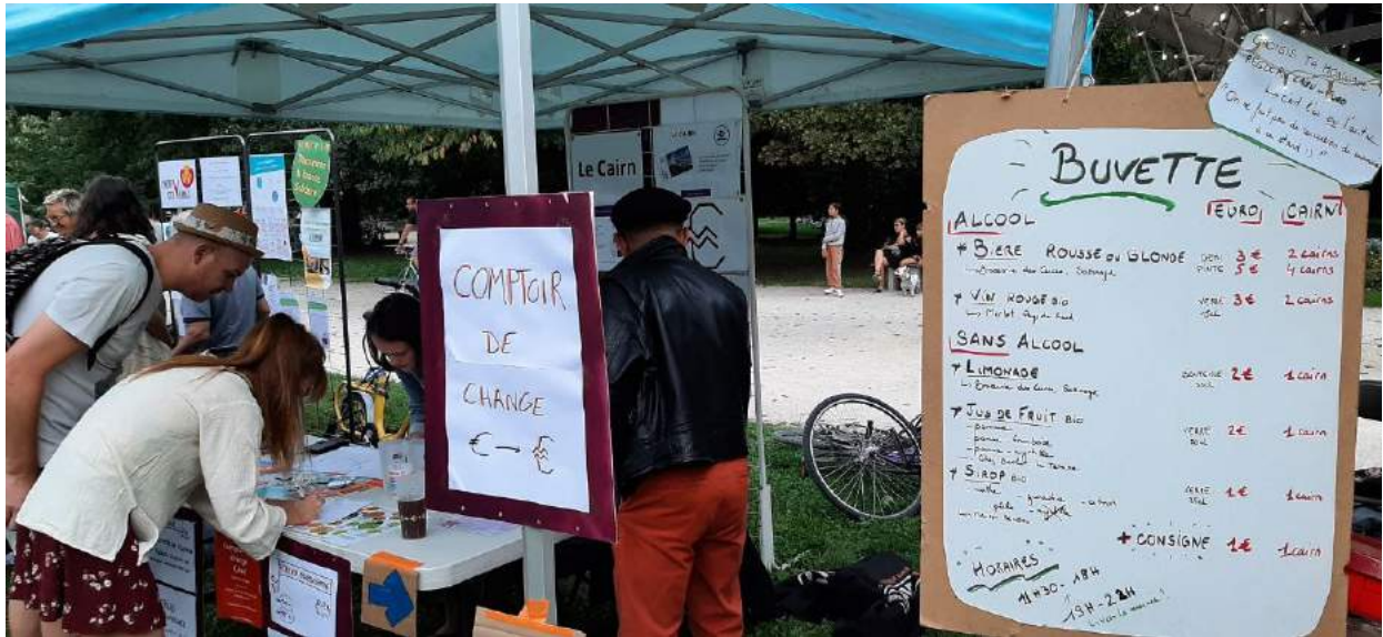
Figure 2: Villages des alternatives par Alternatiba en septembre 2021

L'évènement « Le Cairn prend l'Air » organisé par les bénévoles du groupe local Sud Grésivaudan fut renouvelé pour la 2 e fois en juin 2021, et fut un succès avec autour de 300 personnes présentes, 1700 Cairns échangés et 15 structures co-organisatrices de l'évènement.