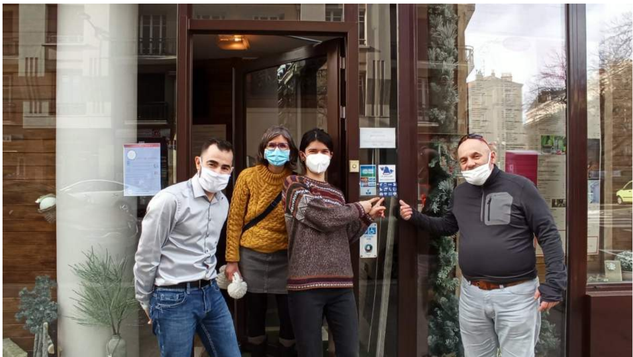
Figure 6: Démarchage du Carillon au Jardin des belles à Grenoble en janvier 2021